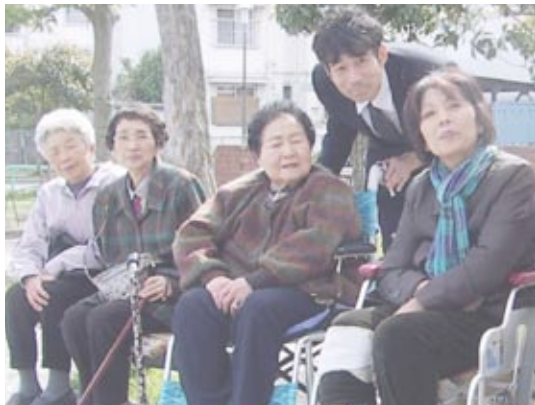
大地震の影響で余震や原発事故続くなか・・・そんなときこそ笑顔を心がけました(写真:桜見学)

「生活相談員とは、ご利用者お一人お一人の人柄や状態などを把握し、ご利用者・ご家族・ケアマネジャーなどとの一つのパイプ役・・・介護現