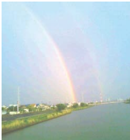
復興という名の虹がかかるよう願っています

の取り組みを通して、東京からエールをおくりたいという気持ちと、地域全体で、復興の「光」を導く方法を考えようという試みがあります。