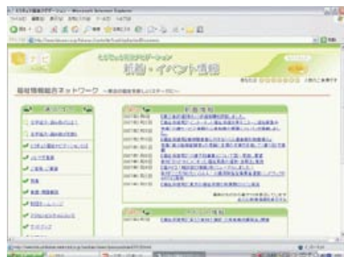
評価結果は「とうきょう福祉ナビゲーション」でご覧いただけます ( http://www.fukunavi.or.jp/fukunavi/index.html )

を行うことその他の措置を講ずることにより、常に福祉サービスを受ける者の立場に立つて良質かつ適切な福祉サービスを提供しなければならぬ。』とされています。