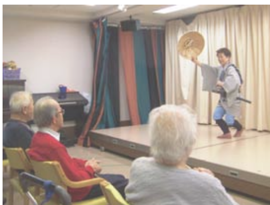
迫力ある踊りに、ご利用者方は、いつの間にか釘付けです!!

清しいフラダンスや、情緒的で芸術的な日本舞踊・陽気な「かつぽれ」と続き：終演時には、「また来てね」「楽しかった」と握手を求めるところ利用者が多く、「里見会