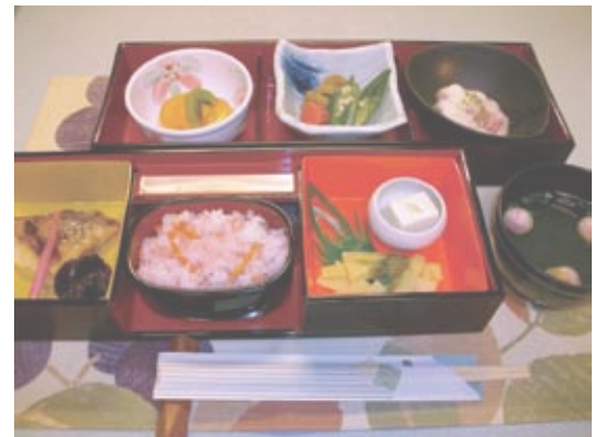
桜ちらし、すまし汁、赤魚の西京焼き、ほたての甘辛煮、まぐろの山かけ・・・豪華な食事内容でした