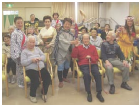
里見会の皆様の活気ある舞台に感謝を込めて…記念撮影です♪