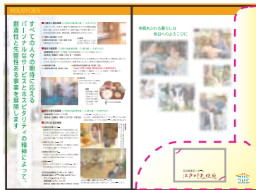
コンセプトは・・・笑顔あふれる生活です

また、平成22年4月から変更となった利用料金や新たに始めたサービスの詳細など、最新の情報が掲載されております。