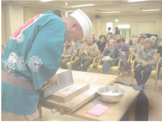
そばを目の前で包丁さばきを披露する職人さんにご利用者の視線は釘付けです

デイサービスでのイベントは様々ありますが、今年、「そば打ちショー」が多目的ホールにて開催されました。そば打ちの職人さんは、メイクにて工程を説明され、ご利用者の質問にも分かりやすく答えてくださり、興味深そうにそばを打つ様子を覗き込む姿が多く見られました。