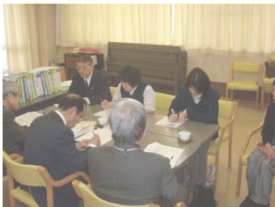
第三者評価機関に内容の説明を行う職員