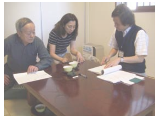
健康手帳を手に報告するお嫁様(写真中央)・・・このような情報が医療従事者との連携を生みます