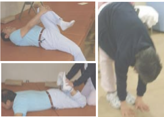
ストレッチを十分に行わなければ運動療法の効果がありません(写真:スライドショーの1コマ)