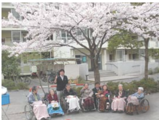
たくさんの元気をもたらした花見・・・全員で記念撮影です

今年「東日本大震災」があり、自粛ムードではありませんが、年に一度の桜の時期に満開の桜を観ることができないのはどうなのか、こんな時