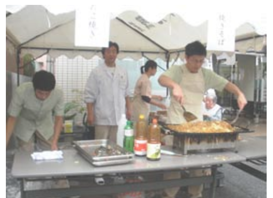
行事は、日清医療食品(写真:左右)と当苑の管理栄養士(写真:中央)が調理担当、ありがとうございます

今後も、ご利用者のより良い生活にご協力いただき、様々な「つながり」を大切に取り組んでいく考えです。