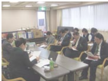
審査は緊張しますが、良い緊張感でした

そのため、サービスの質は向上し、ご利用者に満足いただける最高のサービスが提供されるのです。