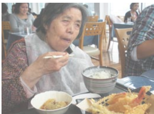
船上のレストランでは、大きな海老のてんぷらに驚き顔で満足されていました

当苑より「長寿のエアール」として、一つご紹介します。あるご利用者が、「海が見たい」の一言…「海」に何かあるのではと考え、去る10月17日(日)に、千葉県・富津金谷に行き、「海の幸」を食べ、潮の香りと共に、「日帰り旅行」を楽しみました。何気ない一言から始まり、ご利用者の生き生きした表情を見てみると…「長寿の秘訣」は、希望を現実することではと、思えてなりません。