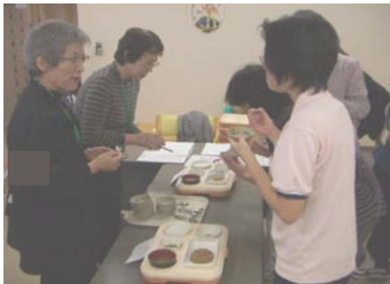
ミキサー食を手に取り、お粥の美味しさに驚いていました

江戸川区では、介護保険と別に区としての福祉施策として様々なサービスマがあります。ところが、なかなか地域の方々に知られず、サービスマで結びつかないことを日々の相談で実感させられます。そこで、周知活動として、