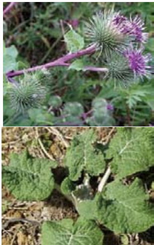
写真:ごぼうの花(上)

またリグニンには抗菌作用があり、ガン細胞自体の発生を予防するともいわれています。