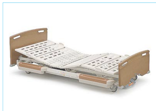
11月には寝心地の良さと安全を考え、ベッドもすべて最新の低床ベッドに変えました

また、個人的にはこれまで同様の講演や連載などの執筆活動に加え、今年はじめに(株)日本医療企画から『介護経営のしくみ』という共著本が出版され、10月には著書『施設サービス計画書のつくりかた』も2刷として増刷され、大手書店に並んでいます。