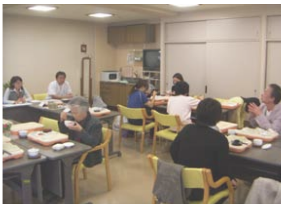
民生委員からの質問もあり、活気のある会となりました

今年度は、5月21日・10月22日に虚弱者向け配食サービスマの試食会を行いました。10月の試食会では、お粥の「甘みがあって美味しい」と、好評でした。福祉施策を地域の方々に伝える機会の多い、民生委員の方やケアマネの方にご参加いただき、サービスマについて実感できたというお声をいただきました。