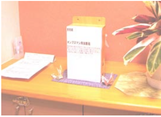
特別養護老人ホームのラウンジとセンター棟は、相談室に投書箱が置かれていますので、書面で申しさせていただきます

る対応が望めません。 そのようなことを考えると、当苑の苦情窓口だけでなく、新たな窓口の必要性を考え、オンブズマン制度に注目しました。 今後携わる方々の中には、なかなか改善されていないことや心境的に言いにくいことなどがある可能性もあり、そんな時、「オンブズマン」の窓口申し出ができたら、どなたに対しても強い味方となるはずです。