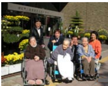
正面入り口は、菊のお花畑・・・記念に一枚♪パシャリッ♪