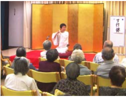
動きのある話にご利用者は引き込まれ、笑いが 絶えません