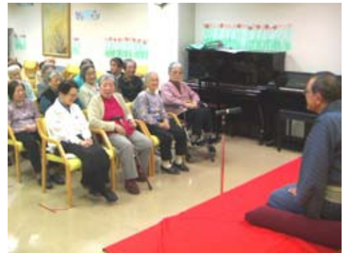
古典芸能ということもあり、不思議と笑い所が、 一致しています