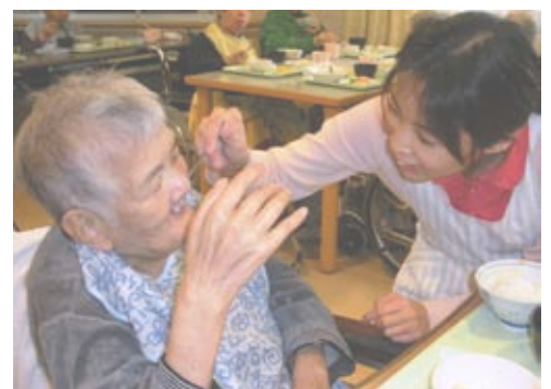
声をかけながら、笑顔で食事の介助をしていました

実習中は利用者の方々とは会話などに関わるなかで、「利用者の方々の些細な表情の変化がうれしい」「職員の方々も介助の説明がわかりやすく、勉強になる」と話されました。