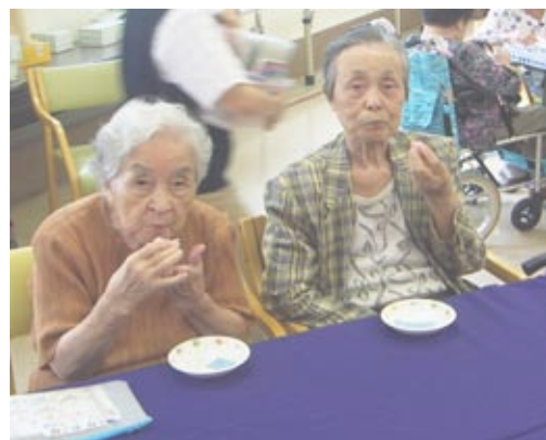
装飾されたホールで「おいしい」と記念撮影