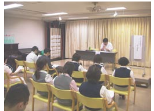
実際にあった事例を元に説明があり、分かり易く、現場に役立つ内容でした