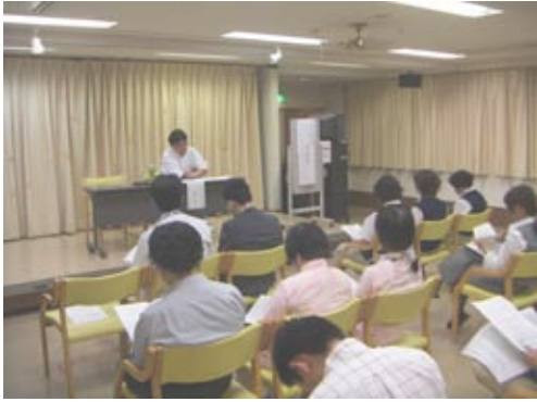
「生」を考えるためには、まず当事者の気持ちになってみる事が大切という言葉に職員も、うなずく光景がありました。

残された「生」を生きていく事を支援するには、身体的な苦痛（痛み）を取り除く対処療法と死を受け入れるまで