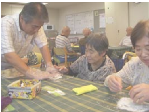
「難しいよ」といわれ、職員が少しお手伝い