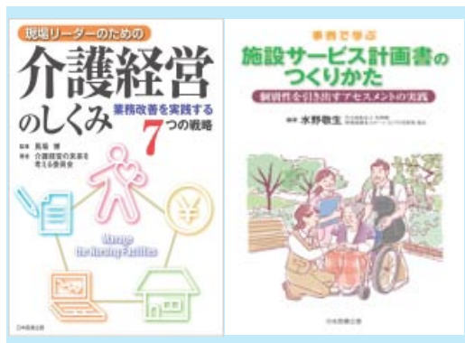
『施設サービス計画書のつくりかた』はすでに4千部を超える人気です