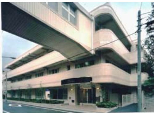
受け入れる側＝当苑の窓口が「鍵」となります (写真：江戸川光照苑玄関前)