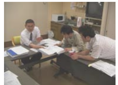
勉強会では身乗り出し、マニュアルの説明を聞く職員もいました